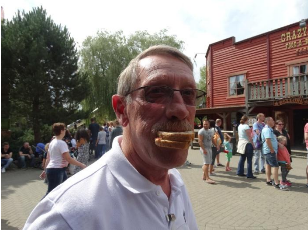
Jac heeft al honger